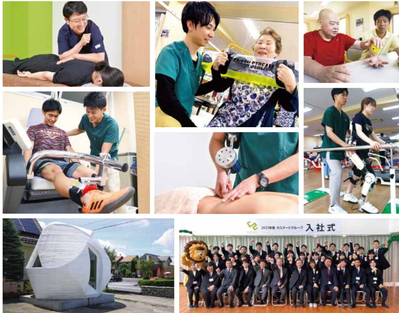
2023年5月 佐久市に日本初の3Dプリンターで建設した 未来の治療院「スフィア」が完成