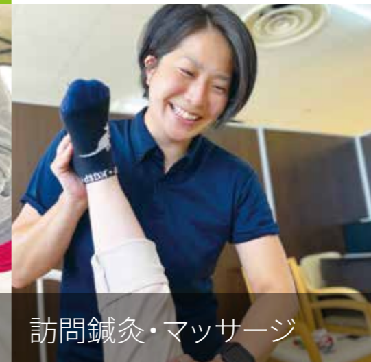
訪問鍼灸・マッサージ