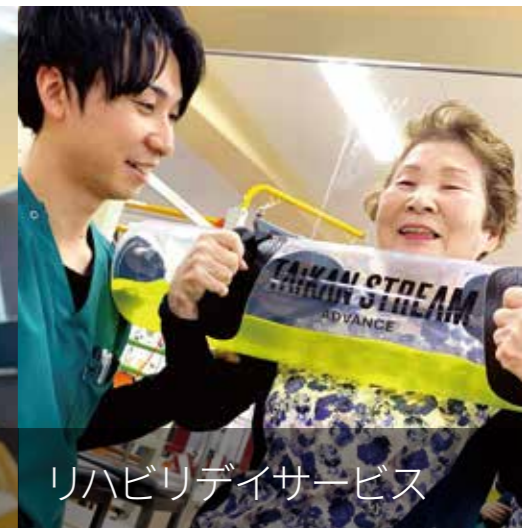
リハビリデイサービス