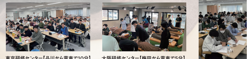
東京研修センター【品川から電車で10分】 大阪研修センター【梅田から電車で5分】

社員育成に投資を惜しまないぷらすだからこそ実現するアカデミー施設。同期全員でまるで学校のように学べる快適な空間です。