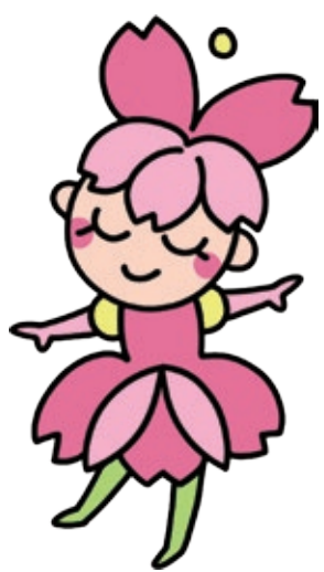
さくらのふーちゃん (株)さくら総合福祉のオリジナルキャラクター