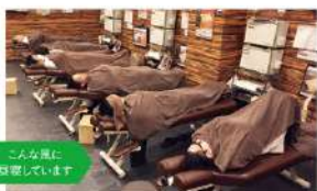
ごみ処理に 専念しています

仕事が充実するためには、ONとOFFの重要性、プライベート、家族の時間を大切にしたいと考えています。