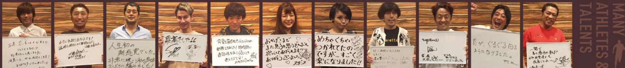
浦和レッズ 柏木 陽介 選手 元WBC世界フライ級チャンピオン 内藤 大助 様 総合格闘家・タレント 高田 延彦 様 タレント JOY 様 タレント メンタリストDaiGo 様 タレント スザンヌ 様 歌手・タレント misono 様 2丁華組 小堀 裕之 様 ネプチューン 堀内 健 様 フルーツボンチ 村上 健志 様 タレント はなわ 様