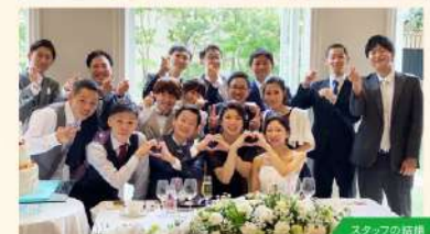
スタッフの笑顔みんなが嬉しい！