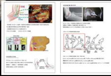
スクリーニング教材より抜粋